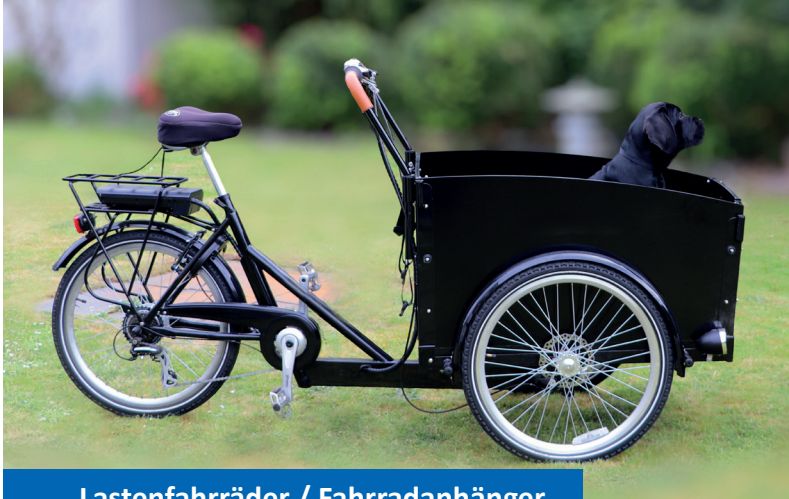
Lastenfahrräder / Fahrradanhänger

Ziel der Förderung von Lastenfahrrädern ist, dass noch mehr Kurzstrecken – anstatt mit dem Auto – mit dem Fahrrad zurückgelegt werden. Mit der Förderung des Fahrradverkehrs soll der innerstädtische Verkehr reduziert und die Luftqualität in der Stadt verbessert werden.