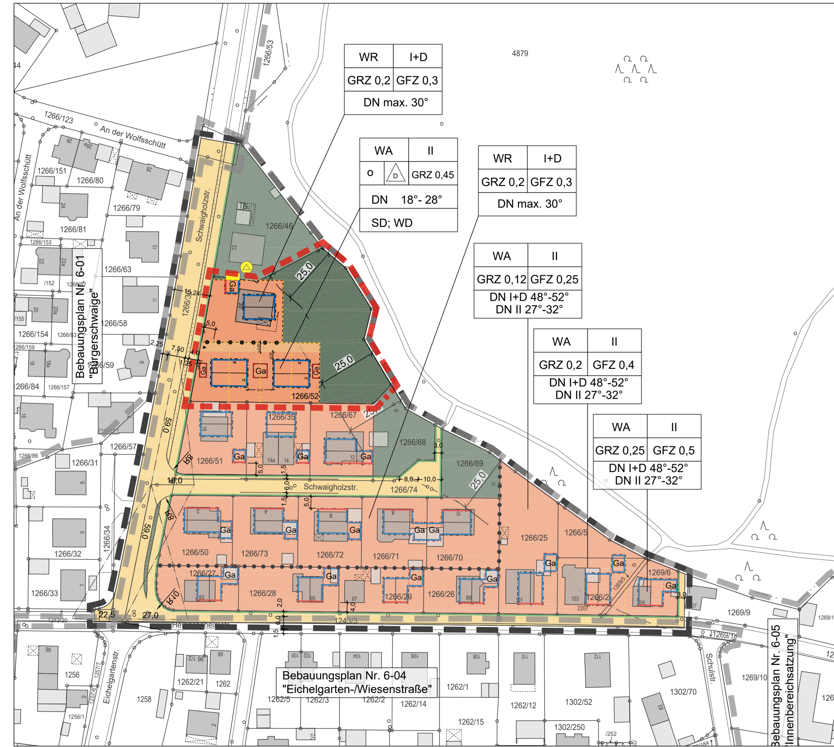
Bebauungsplan Nr. 6-02.1 "Bürgerschwaige Ost" 1. Änderung des Bebauungs- und Grünordnungsplans Nr. 6-02 "Bürgerschwaige Ost" im beschleunigten Verfahren zur Innenentwicklung nach § 13a BauGB M 1 : 1.000