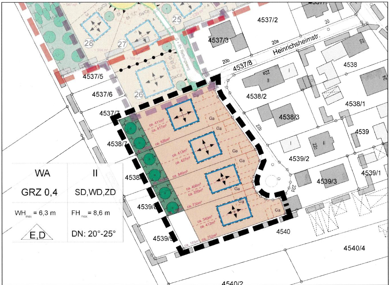
3. Änderung Bebauungs- und Grünordnungsplanes Nr. 1-56 „Heinrichsheimstraße West II“ Originalmaßstab M 1:500