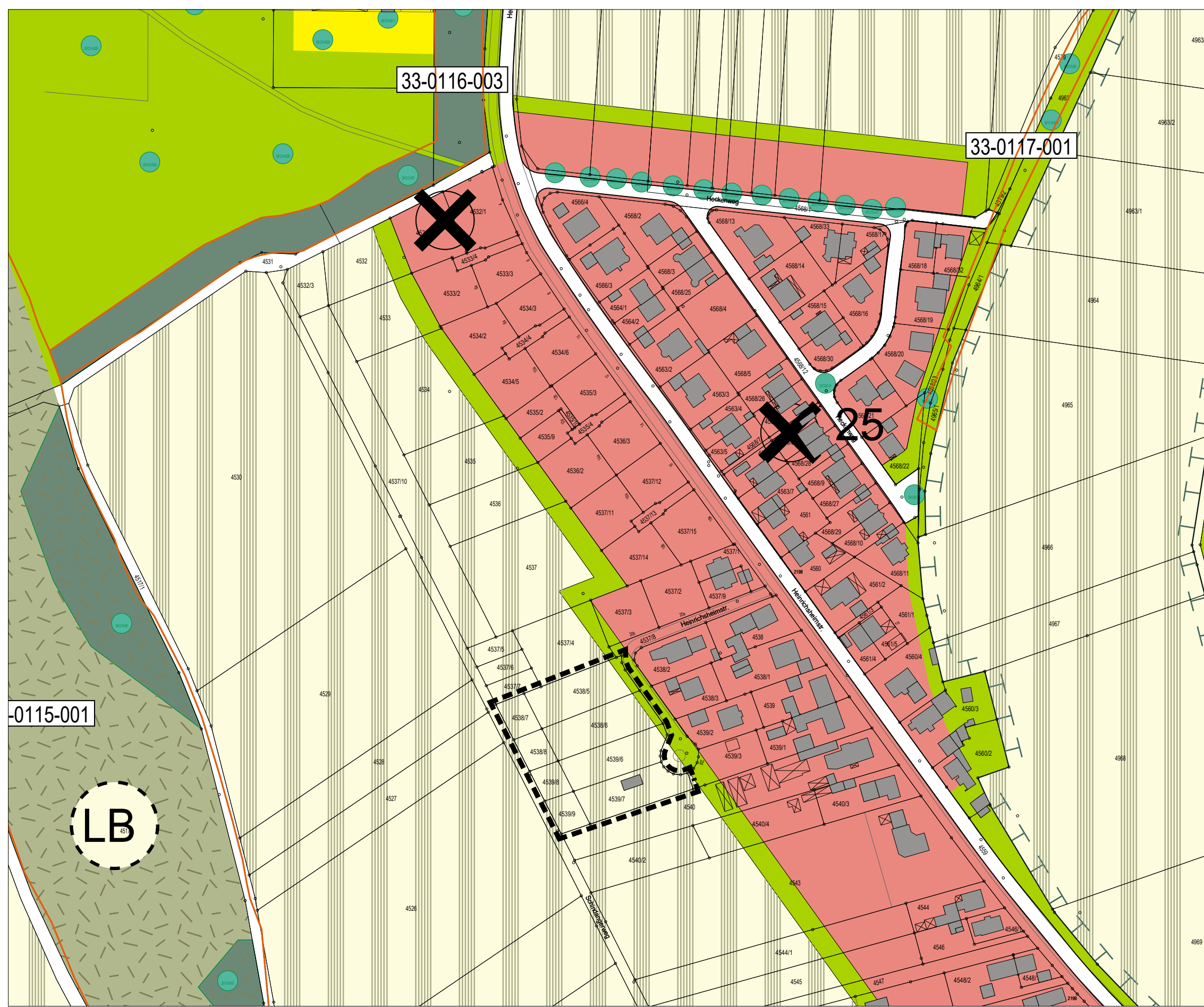
Auszug aus dem rechtsgültigen Flächennutzungsplan