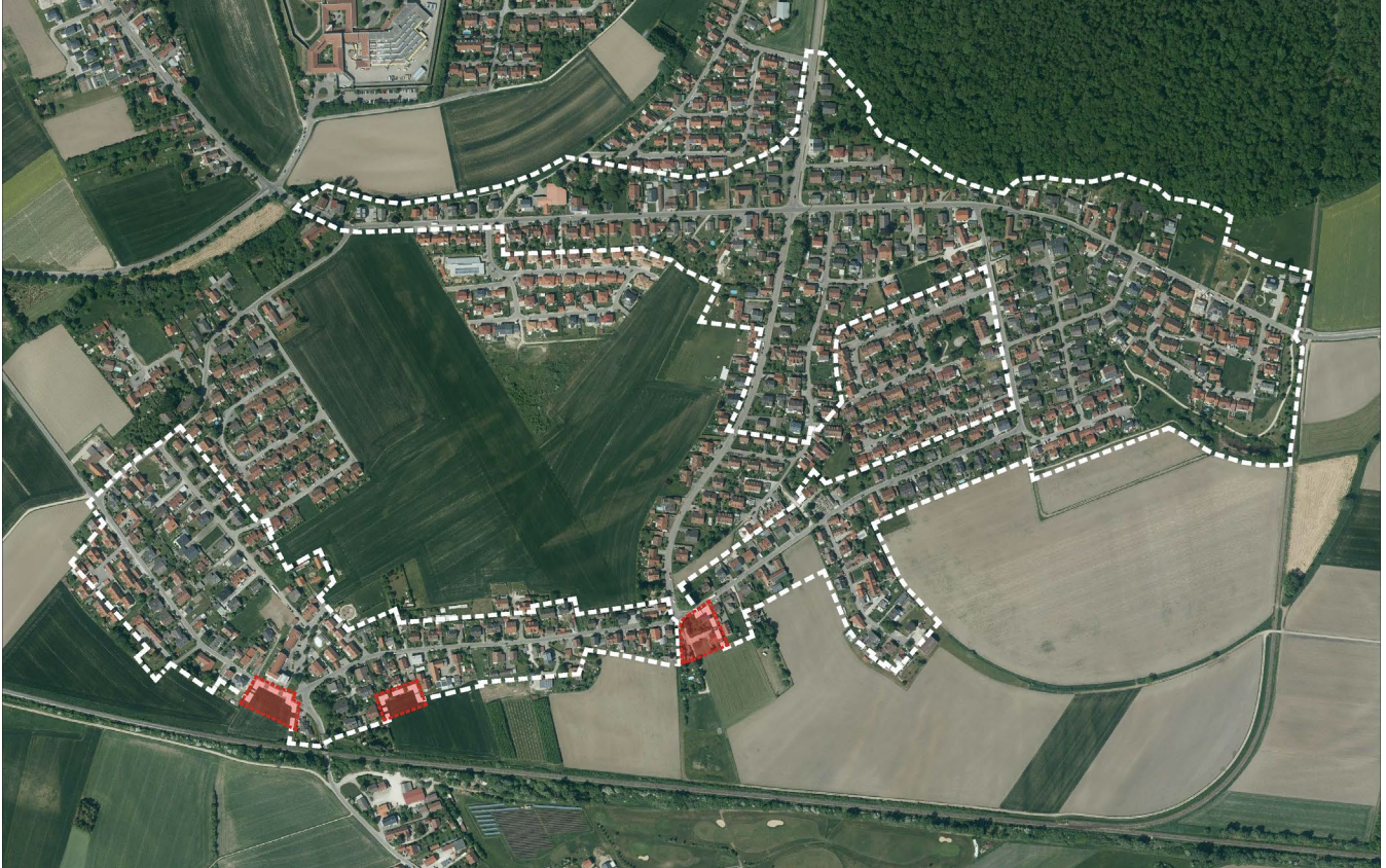
Luftbild mit Darstellung des Geltungsbereichs in Weiß und der Erweiterung in Rot

Der Geltungsbereich der Einbeziehungs- und Ergänzungssatzung Nr. 6-05 befindet sich im westlichen Teil der Stadt Neuburg an der Donau im Ortsteil Heinrichsheim. Er grenzt nördlich an den alten Längenmühlbach bzw. den Ortsteil Heinrichsheim an und wird südlich durch die Bahnlinie der Bahnstrecke Regensburg–Neuoffingen begrenzt.