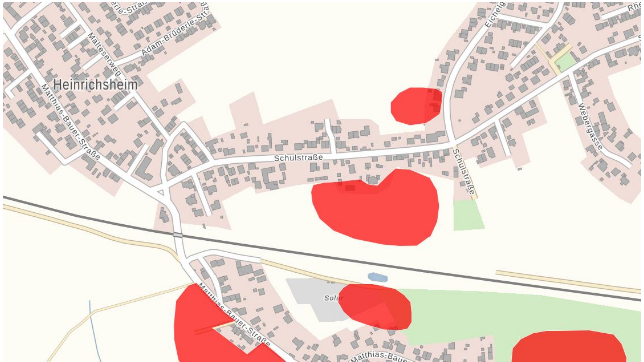
Ausschnitt aus Bayernatlas

In der weiteren Umgebung befinden sich die Bodendenkmäler D-1-7233-0233, D-1-7233-0229 und D-1-7233-001 (Siedlungen vor- und frühgeschichtlicher Zeitstellung bzw. Siedlung und/oder Gräber vor- und frühgeschichtlicher Zeitstellung).