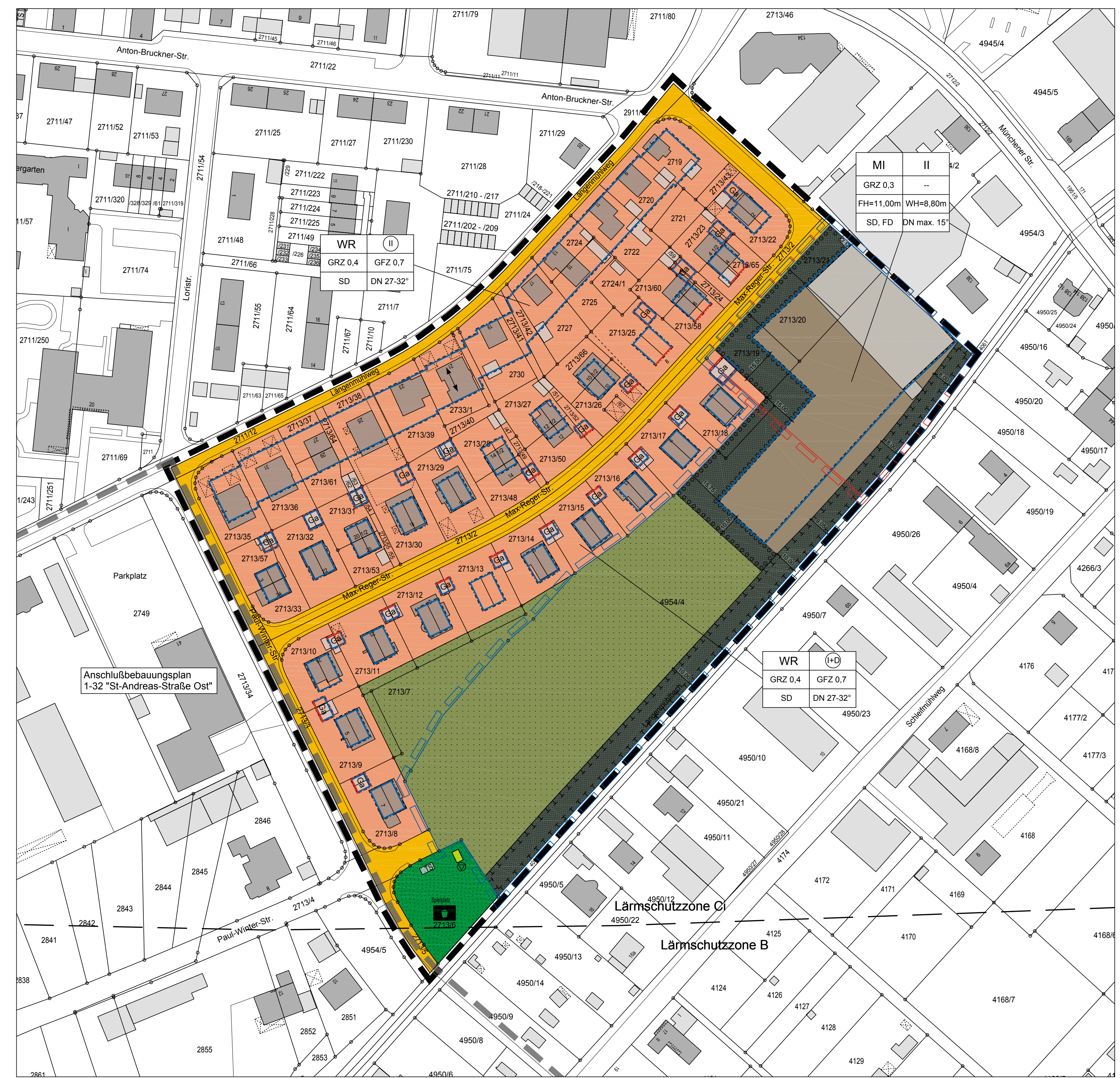
Bebauungsplan "Längenmühlweg/Längenmühlbach" M 1 : 1.000