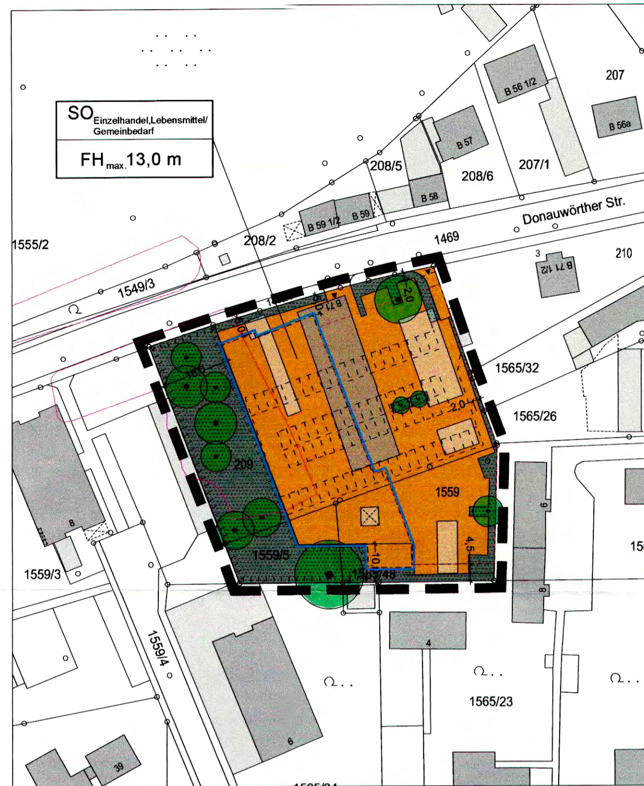
Bebauungsplan Nr. 1-62 "SO Donauwörther Straße" M 1 : 1.000